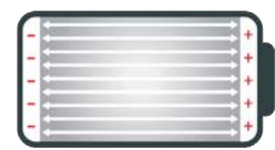
Nouvelle cellule de batterie Tabless, avec un flux d'électricité efficace sur toute la surface de l'électrode